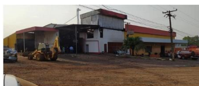
Moinho Talita é parcialmente destruído pelo fogo em Santo Antônio do Sudoeste

Entretanto, no dia 07 de outubro de 2020 um incêndio de grandes proporções atingiu a planta de produção da Talita Indústria de Farinhas Ltda, destruindo toda área de industrialização da empresa: